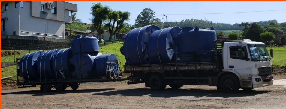
Entrega de reservatórios finalizada no município de Quilombo para as ações de combate a estiagem do Governo do Estado.

explicou sobre a importância da obra para a região, “Inicialmente, o projeto está sendo construído para a contenção de cheias, mas a estrutura foi planejada para a captação de água e, futuramente, também para a geração de energia elétrica”, destacou. A Barragem tem como principais objetivos diminuir as inundações no Vale do Rio Itajaí Mirim, sustentar a segurança hídrica para abastecimento de água aos municípios de Brusque, Itajaí, Botuverá e Balneário Camboriú, preservar a vazão hídrica do Rio Itajaí Mirim e promover o desenvolvimento socioeconômico da Região.