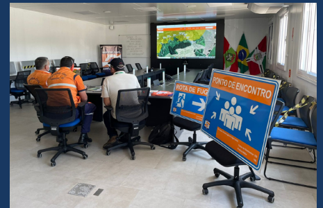
Reunião com representantes da CEMIG e Defesa Civil Municipal de Xanxerê realizada no Centro Integrado de Gerenciamento de Riscos e Desastres (CIGERD) de Xanxerê para ações de implantação das rotas de fugas e pontos de encontro dos planos de ação de emergência das barragens de PCH Voltão e PCH Passo Ferraz.