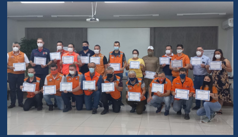
Encerramento do curso BAGER, realizado pelo Colegiado Regional de Coordenadores Municipais de Defesa Civil da Região do Alto Irani.