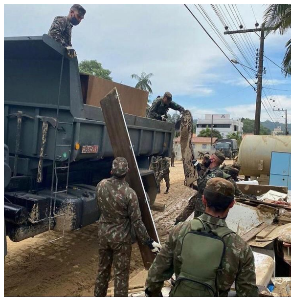
Imagem 04/05 -EB em Presidente Getúlio.