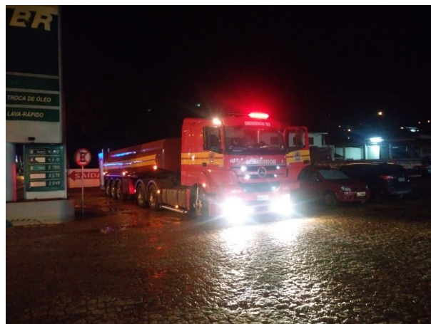
Imagem 06/07 -CBMSC em Presidente Getúlio.