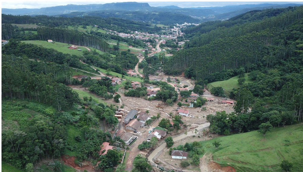
Imagem 01 - Sobrevoio Presidente Getúlio