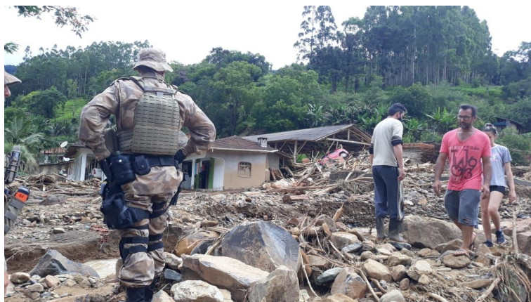
Imagem 02/03 -PMSC em Presidente Getúlio.