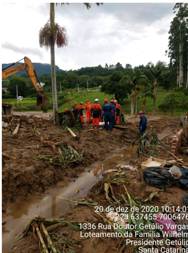
Imagem 08 - CBMSC -